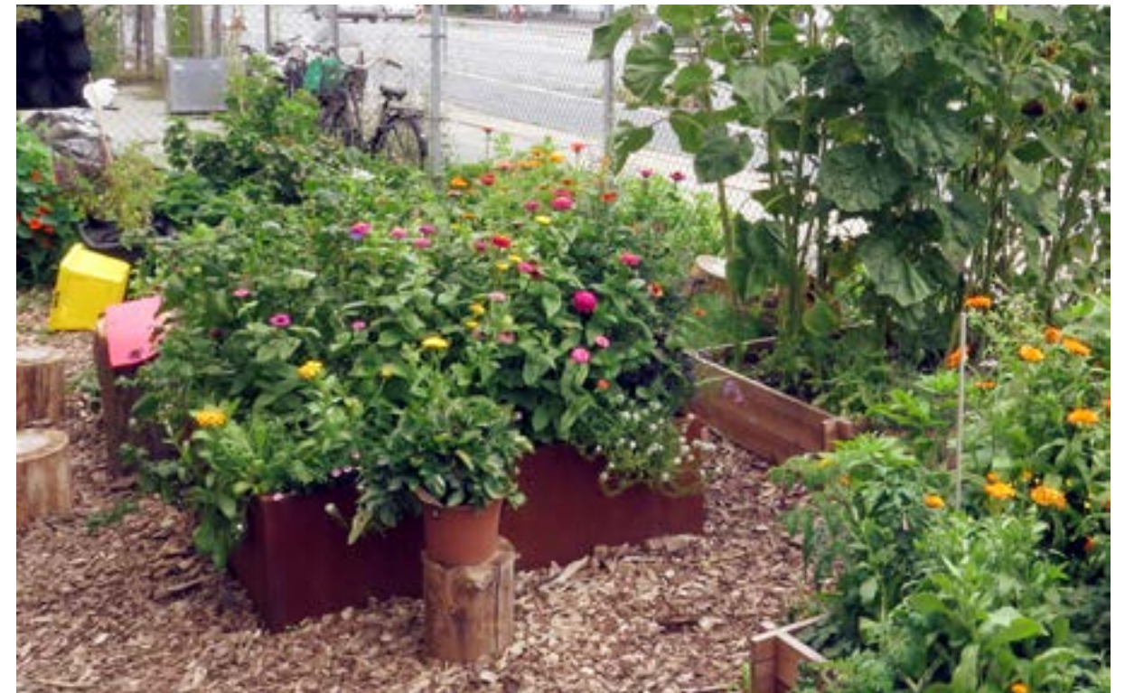
Højbede ved herberget i Nordvest - morgenfruer, frøkenhat og solsikker.