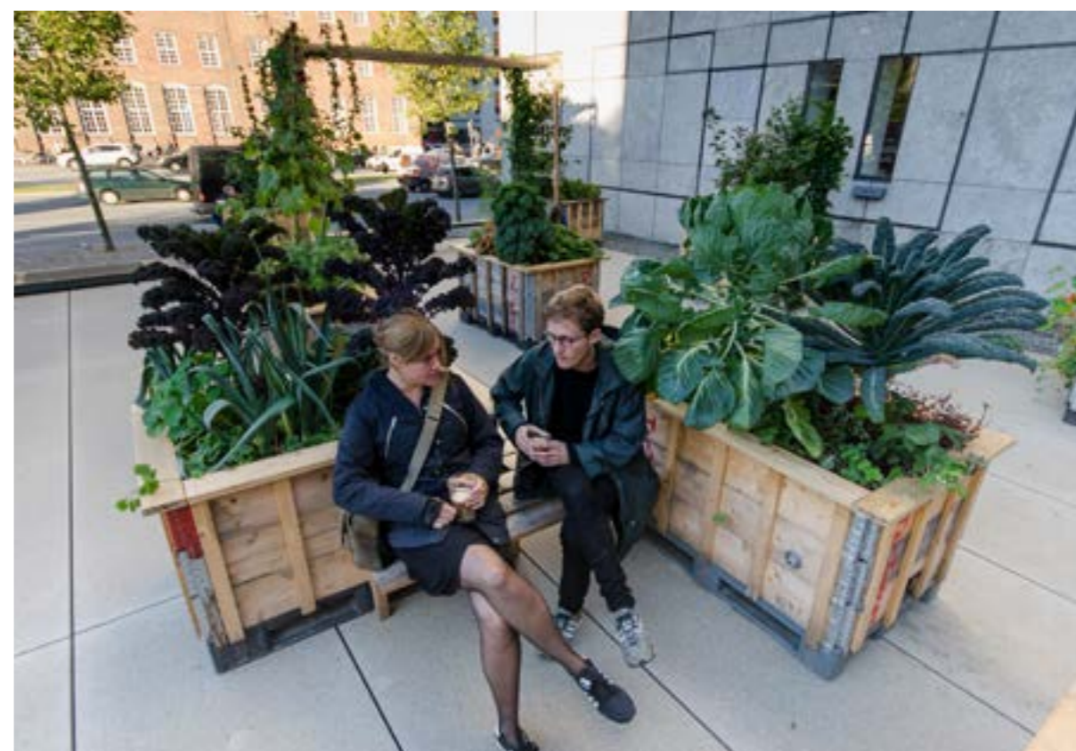
Mobile højbede kombineret med bænke hos Realdania.