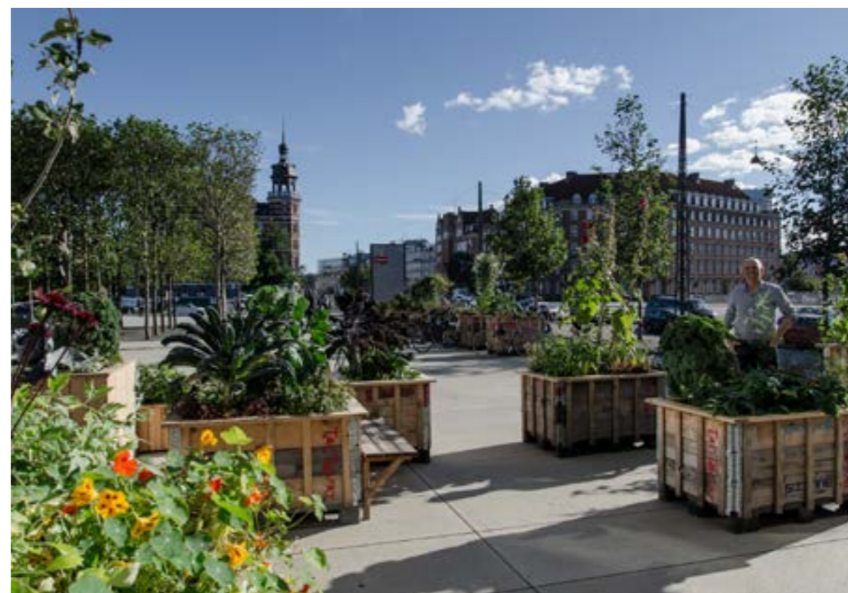
Mobile højbede skaber rum under Kulturnatten hos Realdania.